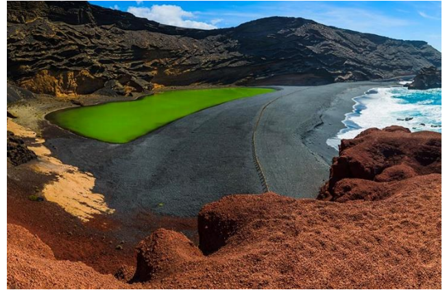
Le lagon vert de Lanzarote !